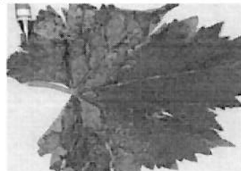
Mana vita de vie

- tratamentul I - cand lastarii au 20-25 cm (degajarea ciorchinilor)