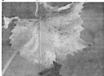
Fainare vita de vie

Oficiul Fitosanitar Botosani recomanda efectuarea a două tratamente pentru combaterea manei, făinării, pătării roșii a frunzelor, acarienilor , care pot cauza pierderi importante la cultura de VITA DE VIE.