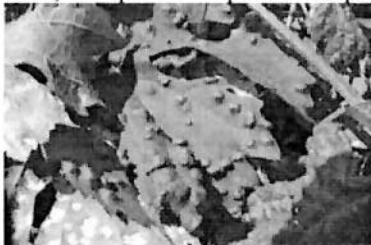
Atac acarieni pe frunze